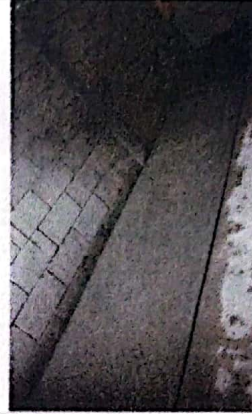
Foto 2: Colocación de losa de piso torta del mejoramiento tipo pórtico