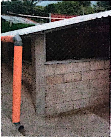
Foto 3: Instalado las ventanas de maya del mejoramiento tipo pórtico